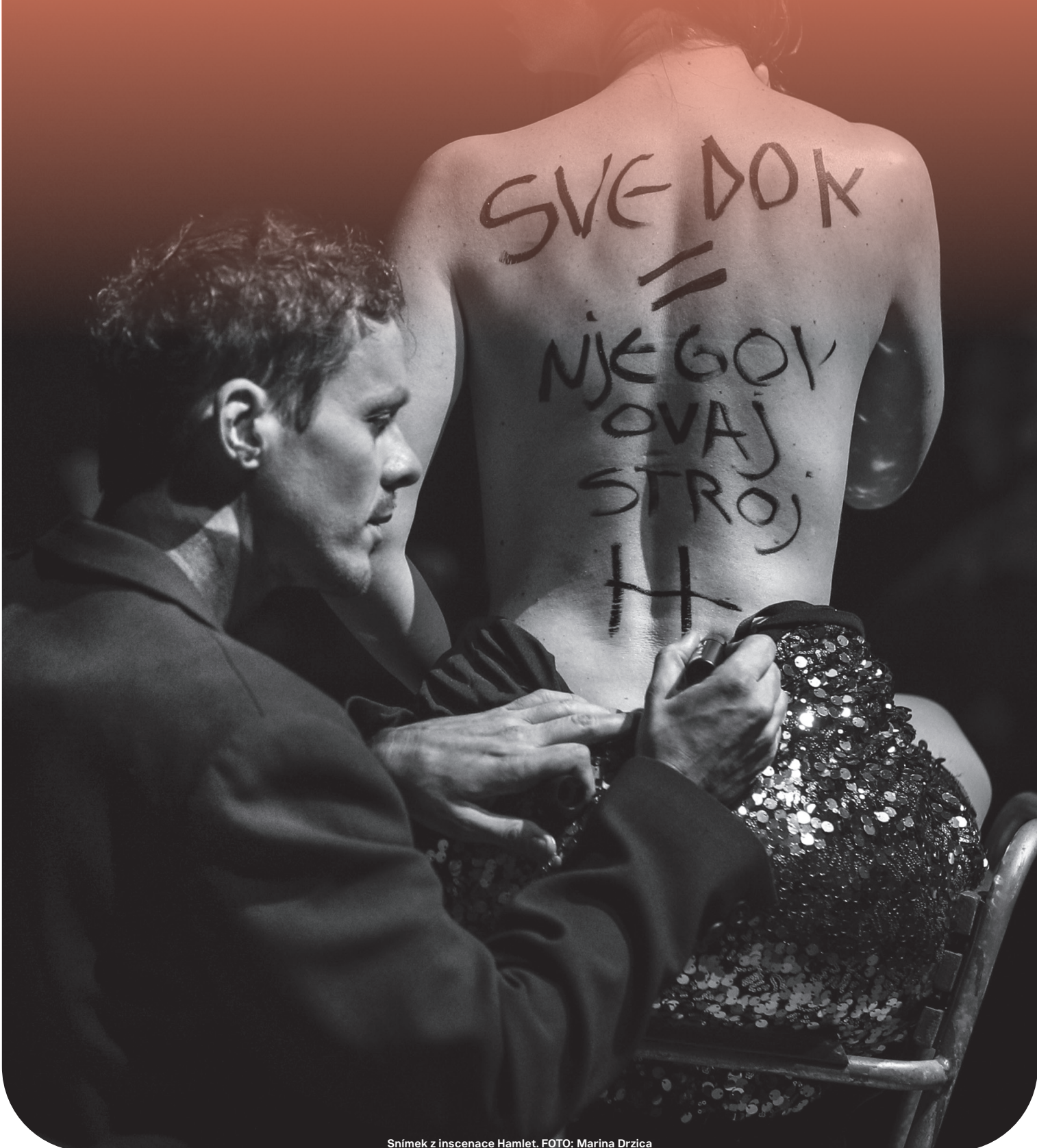
Snímek z inscenace Hamlet.